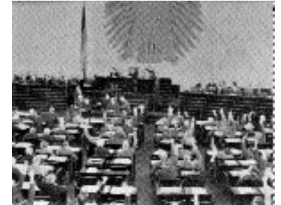
Das bester aller Systeme. Denn: Wer hat denn den Kommunismus überlebt?!

Die Psychologie versetzt ihre wißbegierigen Studenten gerne in ein kahles ideelles oder sogar wirkliches Meßlabor, in welchem alles Treiben der Leute als Äußerung eines jeweils zugrundeliegenden Leistungsvermögens oder als Resultat von dessen Beeinträchtigung verständlich und / oder berechenbar gemacht wird, wobei je nach Dozent mal das Rechnen, mal das Verstehst-mich den Vorrang bekommt. An Würmern, dressierten Affen, dem Augapfel und erst im Oberseminar an Psychokisten der lebendigeren Art denkt man sich in eine Hinterwelt determinierender Seelenkräfte hinein. Wenig davon hat man jemals erlebt. – Aber andererseits: Das Prinzip des Ganzen ist Leuten nicht fremd, die längst praktisch gelernt haben, sich selbst als mehr oder weniger taugliches Mittel in verschiedenen Konkurrenzkämpfen einzusetzen, also auch so zu interpretieren.