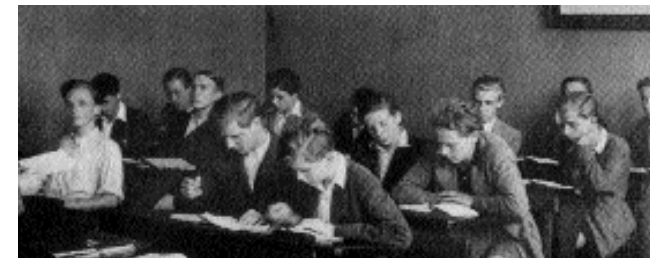
Mitschreiben ist wichtig, klar; man muß wissen, was der Prof will. Doch das ist nicht alles. Eines will für den Abschluß auch gelernt sein: Selbstdarstellung

Das fordert nicht mehr bloß Gedächtnis und Verstand, sondern den ganzen Mann resp. die gesamte Frau. Das Studium wird zur Imagepflege und zur Vorbereitung jenes guten Eindrucks, den man pünktlich machen muß. Genau in jenem alles entscheidenden Moment behält jedoch trotz aller Vorbereitung der Zufall sein Recht: die „Tagesform“ des Prüflings, der es mit dem Valium nicht übertreiben darf, vor allem aber die Laune des Prüfers, der seine Pflicht, auszusortieren mit seiner Geneigtheit für die eine und gegen die andere Tour der Selbstdarstellung zu erfüllen pfllegt. So