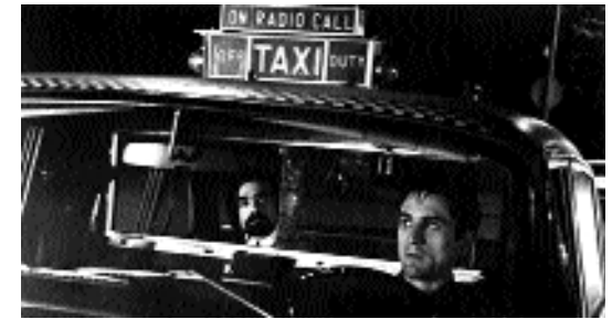
Viele Akademiker landen da, wo sie eben landen, wenn das Kapital keine Verwendung für sie hat: Sie müssen sich mit z.B. als Taxifahrer für wenig Geld durchs Leben schlagen.

– Erstens wären die besseren Leute, die sich an höheren Bedürfnissen messen als die gewöhnlichen und damit auch noch als deren Vorbild Anerkennung beanspruchen dürfen, nur deshalb welche, weil sie über das gesammelte