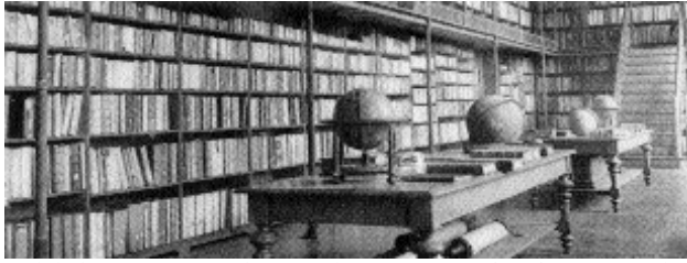
Unibibliothek: Bücher, die gewaltigere Fragen aufwerfen, als „Was ist das und warum?“. Aber bekannt sind sie schon, denn die ideologische Botschaft der Fächer kennt man von den gängigen Allgemeinplätzen, die einem täglich entgegen schlagen...