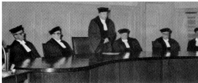
Alles was Recht ist! Diese Herren haben gelernt, wo der Hammer hängt.

der Gesetze und Urteilssammlungen, die dem Studienanfänger zunächst einmal viel zu Staunen geben – so geläufig ein gesundes Rechtsempfinden ihm andererseits ist. Statt einer wissenschaftlichen Methode sind es da Rechtspraxis und Kommentare, die das Tun und Lassen der Menschen insgesamt in ein eigentümliches Licht rücken nämlich das des staatlichen Gewaltmonopols, das die juristischen Fragen aufwirft. Diese Fragen sind erstens zu lernen, und zwar so, wie es bei dieser Art „Probleme“ einzig geht, nämlich auswendig; deswegen sind sie zweitens noch eigens zur gewohnheitsmäßigen Beurteilungsweise zu „verinnerlichen“.