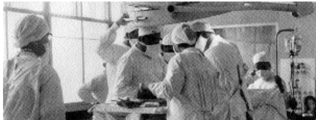
Auch bei den Leuten, die sich mit einer richtigen Wissenschaft beschäftigen, kommen nicht umhin: ihr bißchen brauchbares Wissen als Mittel ihres Konkurrenz Erfolgs in Anschlag bringen.

Studenten der Naturwissenschaft brauchen bei dieser Bildungsveranstaltung, die den eigentlichen Unterschied zwischen die studierte und die nicht-studierte Menschheit legt, übrigens nicht abseits zu stehen, bloß weil ihr Stoff vernünftiger beschaffen ist als der der Geistesfächer. Schließlich müssen auch sie sich an Leistungsbeweisen sortieren, also mit ihrem Wissen, obwohl es stimmt, den Zufall der ausgewählten Prüfungsfragen meistern und eine dadurch bestens begründete Angst bewältigen. So gewöhnen auch sie sich daran, ihr bißchen gutes Wissen als Mittel ihres Konkurrenz Erfolgs und Qualitätsmerkmal ihrer akademischen Persönlichkeit zu handhaben und in die Künste der Selbstproblematik und -ermunterung einzuwickeln.